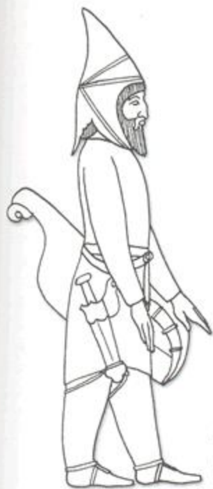
Рис. 2.57. Прорисовка изображения сакского воина на персепольских барельефах