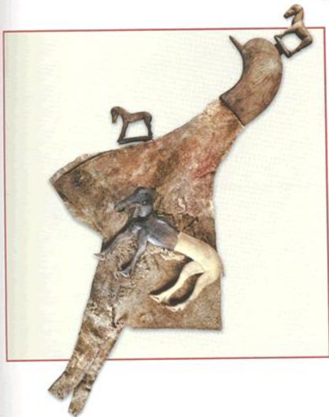
Рис. 2.58. Мужской войлочный шлем и его украшения. Курган 1, могильник Ак-Алаха-1. МА ИАЭТ СО РАН