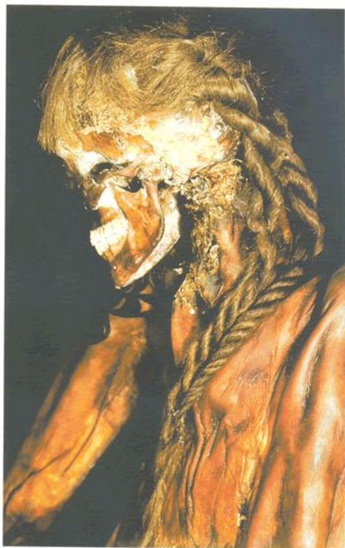
Рис. 2.61. Прическа пазырыкского мужчины: а — мумия; б — реконструкция (исполнена Д. В. Поздняковым). Курган 3, могильник Верх-Кальджин-2, МА НАЭТ СО РАН